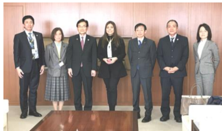
江口副知事表敬訪問