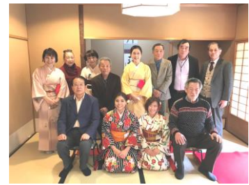
着物着付け・茶道体験