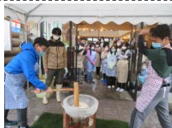
「Experiência de fabricação de mochi」