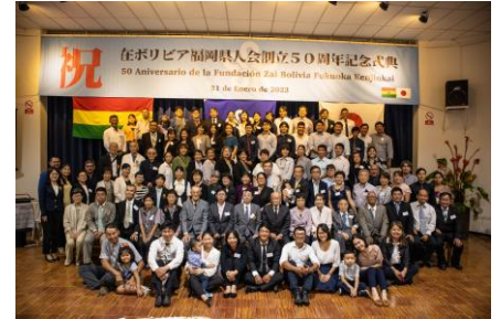
【Cerimônia de Comemoração da Bolívia】