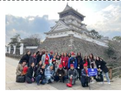
「Castelo de Kokura」