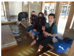
「Experiência de banho de pés」