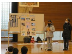
「Visita à escola primária」