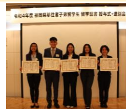
【Cerimônia de conclusão dos bolsistas de 2022】

No dia 11 de Março, foi realizada a cerimônia de conclusão dos cinco bolsistas da Província de Fukuoka. Os estudantes internacionais relataram o que aprenderam ao longo do ano e as muitas conexões que fizeram durante o seu tempo em Fukuoka, e expressaram a sua gratidão a todos os envolvidos. Aguardamos com expectativa as suas futuras atividades em seus Kenjinkais de origem, onde adquiriram uma várias experiências e amadureceram. Além disso, em janeiro de 2023, foi realizada a experiência de vestir um quimono e a cerimônia do chá em Shofuen, na cidade de Fukuoka.