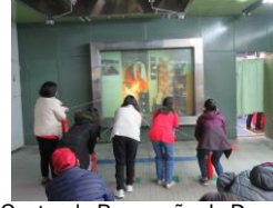
「Centro de Prevenção de Desastres da Cidade de Fukuoka」