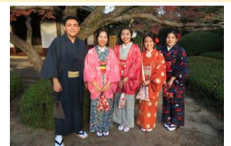
【Experiência de vestir kimono - Cerimônia do chá】