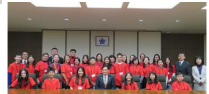
「Visita de cortesia para o vice-governador Eguchi」