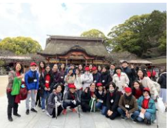
「Santuário Dazaifu Tenmangu」