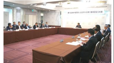
【Estabelecimento de Comitê Geral de estabelecimento executivo】

O " 10º Encontro Geral do Comitê Executivo da Convenção Mundial de Fukuoka Kenjinkai" foi realizado em 29 de maio de 2019 na cidade de Fukuoka. A Associação Internacional de Estrangeiros de Fukuoka é uma reunião das 39 Associações de Fukuoka espalhadas pelos 24 países, onde se reúnem todos os Kenjinkais. O 10º aniversário será realizado depois de seis anos na Prefeitura de Fukuoka, a partir da quarta-feira do dia 6 de novembro até o domingo no dia 9.