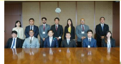
【Visita ao Vice-Governador】

Em maio os bolsistas visitaram o vice-governador Eguchi e receberam as boas vindas: "Espero que vocês sejam bastante ativos no futuro como uma ponte entre Fukuoka e seu país de origem".