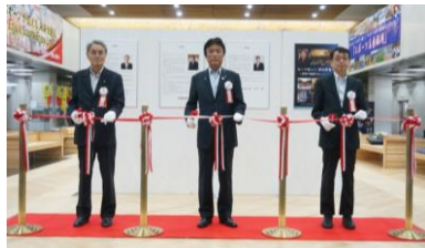
【Cerimônia de abertura】

Segundo o presidente e o governador Ogawa: